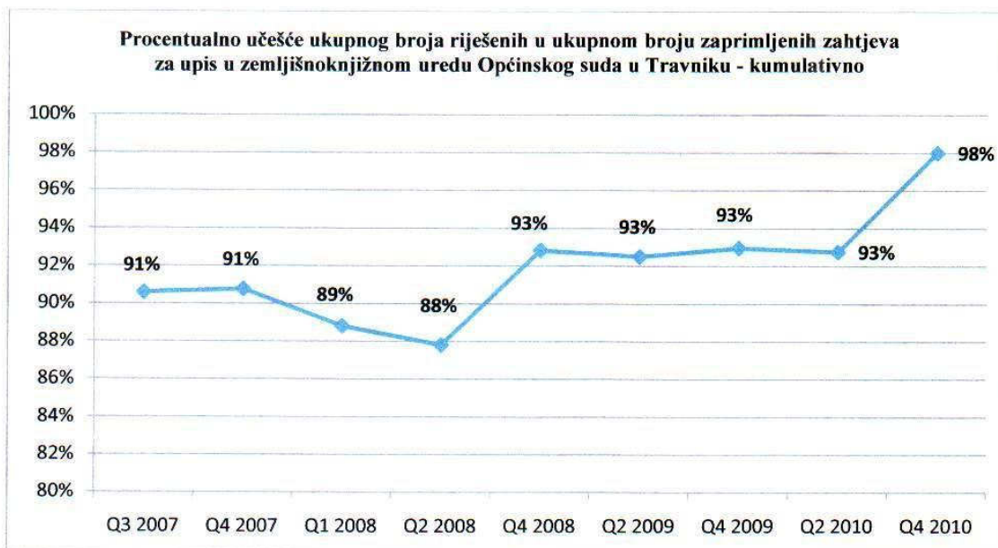
Dijagram 2: Kumulativni prikaz procentualnog učešća ukupnog broja riješenih u ukupnom broju zaprimljenih zahtjeva za upis u zemljišnoj knjizi Općinskog suda u Travniku