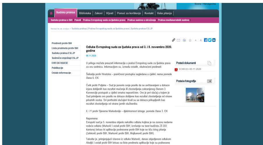
Slika 1.2. Prikaz jedne vijesti o novim odlukama i presudama ESLJP-a.

Predstavljanje svih sadržaja internet stranice, te baze i njenih mogućnosti izvršena je, između ostalog, za 14 studenata Pravnog fakulteta Univerziteta u Sarajevu i Istočnom Sarajevu. Presentacija je napravljena 28. oktobra 2020. godine, a studenti su imali priliku da se putem WebEx online edukacije upoznaju i s radom Odjela za sudsku dokumentaciju i edukaciju VSTV-a, sistemom edukacije novoimenovanih sudija i tužilaca, kao i s procesom rada panelâ za ujednačavanja sudske prakse. Aktivnost je realizovana u sklopu projekta „Izgradnja efikasnog pravosuđa u službi građana“ kojeg finansira Evropska unija, a implementira Visoko sudsko i tužilačko vijeće BiH. Oba pravna fakulteta su zadovoljni uspostavljenom saradnjom, te su predložili da se ove aktivnosti i u budućnosti nastave, odnosno da se s bazom sudskih odluka i njenim mogućnostima za pravna istraživanja upozna što veći broj studenata.