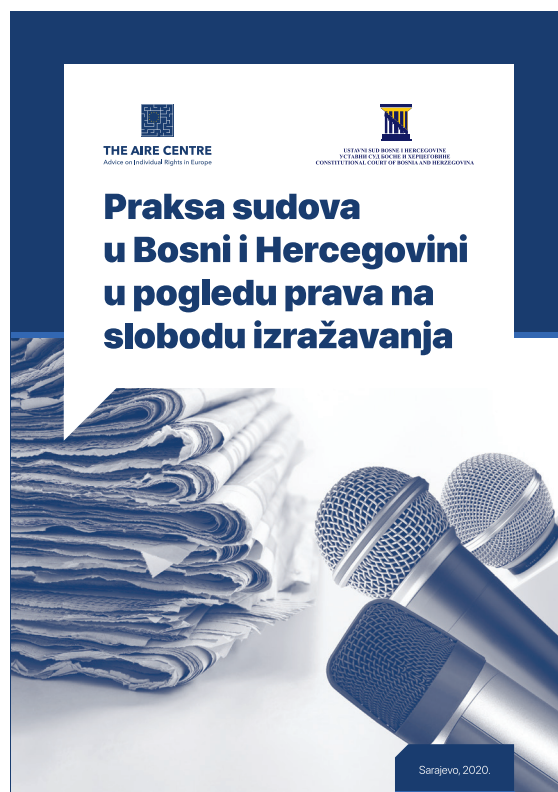
PRAKSA SUDOVA U BOSNI I HERCEGOVINI U POGLEDU PRAVA NA SLOBODU IZRAŽAVANJA https://bit.ly/38jONF1