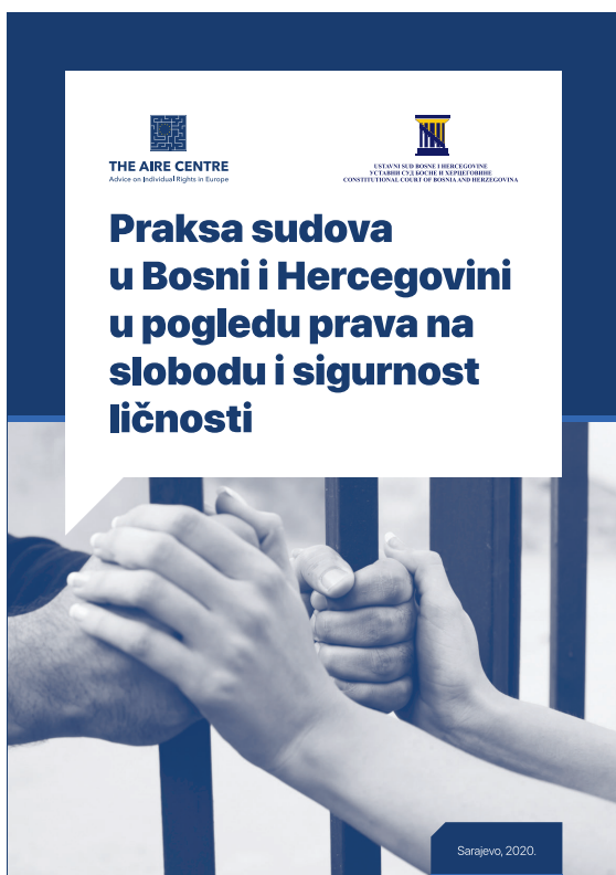
PRAKSA SUDOVA U BOSNI I HERCEGOVINI U POGLEDU PRAVA NA SLOBODU I SIGURNOST LIČNOSTI https://bit.ly/2LrBqJX

Za budući razvoj sudske prakse i ostvarenje cilja harmonizacije sudske prakse u Bosni i Hercegovini sa standardima Evropske konvencije, od izuzetne je važnosti, kako je to pokazao ovaj Izvještaj, da u praksi redovnih sudova i Ustavnog suda postoji dovoljno primjera koji mogu da posluže kao putokaz.