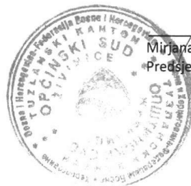
Mirjana Kulić Predsjednica suda

Ova odluka stupa na snagu danom donošenja.